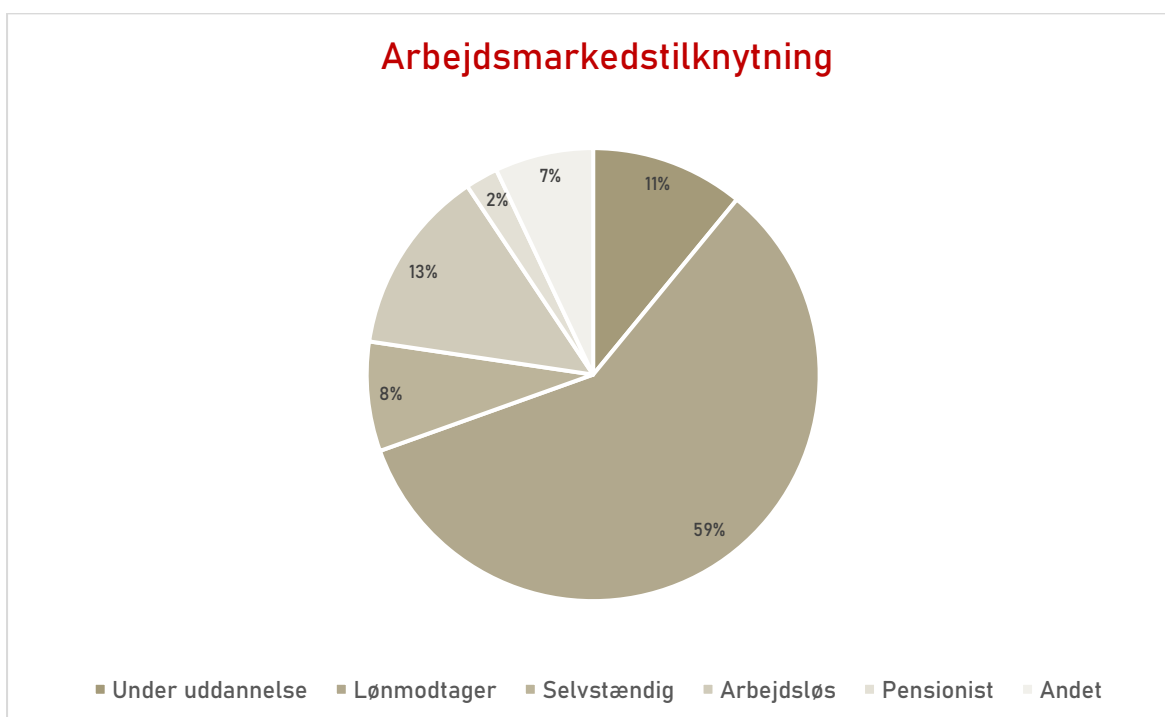
Graf 3.1. Arbejdsmarkedstilknnytning for kvinder i SDTN 2020

Note: Opgjort for kvinder i SDTN 2020. Der er 10 kvinder, der ikke er noteret ved arbejdsmarkedstilknnytning.