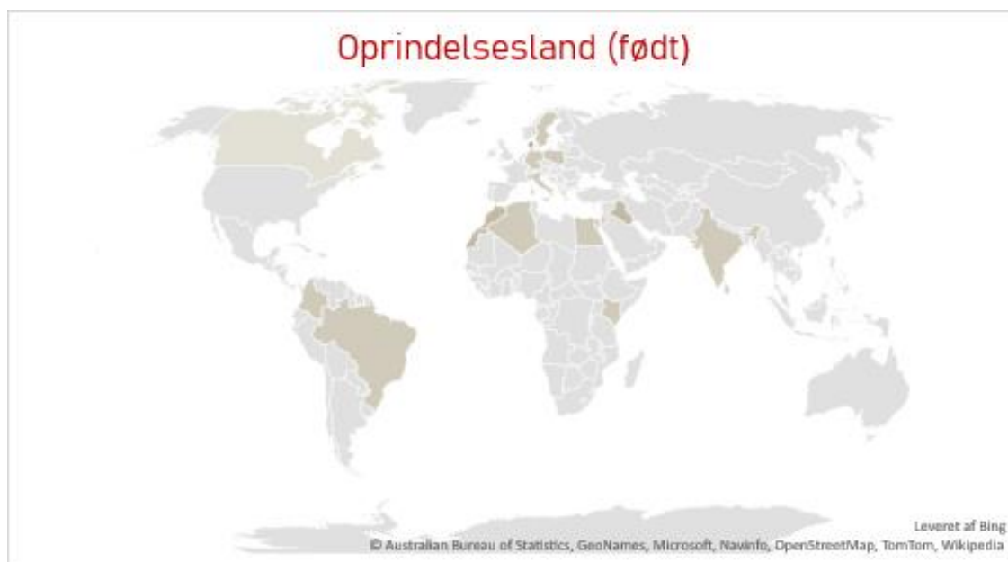
Graf 3.2. Oprindelsesland (fødeland)

Note: N=108. Opgjort for kvinder i SDTN 2020.