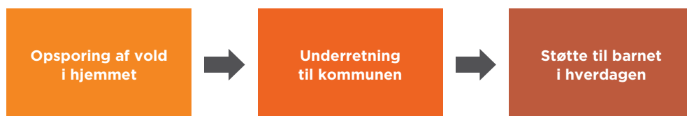
Figur 1: Tre trin til opsporing og håndtering af børn, der oplever vold i hjemmet

Håndbogens indhold bygger både på forskningsbaseret viden, på praksiserfaringer om vold mod børn og på den gældende lovgivning på området. Citaterne i håndbogen stammer fra Lev Uden Volds tidligere udgivelse til børn og unge "Mig og min (særlige) rygsæk. – En bog med viden, erfaringer og øvelser til dig, der har oplevet voldsomme konflikter eller vold i familien".