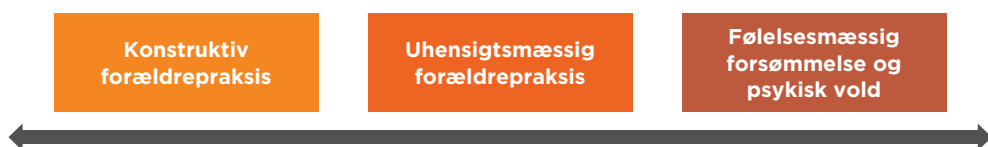
Figur 2: Forældrepraksis langs et kontinuum

Hvis du gennem dit arbejde møder børn, der er udsat for negativ social kontrol eller æresrelaterede konflikter, kan du kontakte RED Rådgivning, der kan give specialiseret rådgivning om konkrete sager om børn og unge med etnisk minoritetsbaggrund, der er udsat for pres, kontrol eller tvang fra familien. Kontakt RED rådgivning for fagpersoner på tlf. 70 27 76 86