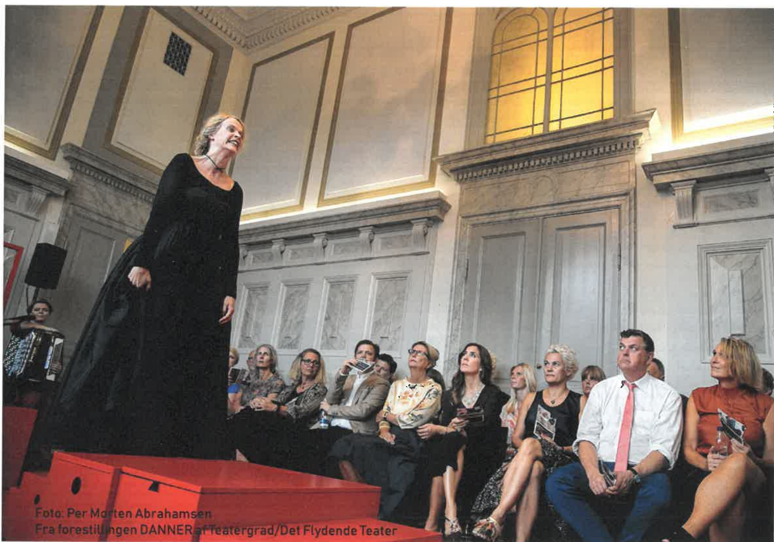
Fra forestillingen DANNER af Teatergrad/Det Flydende Teater